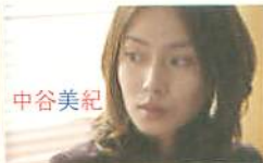
中谷美紀 クールな美貌と小さな胸、宝田。 「私たちには、何か欠けてるの」